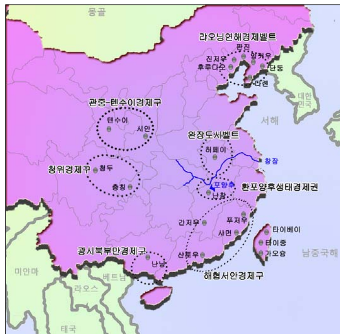
《최근 출범한 중국의 新 광역경제권》