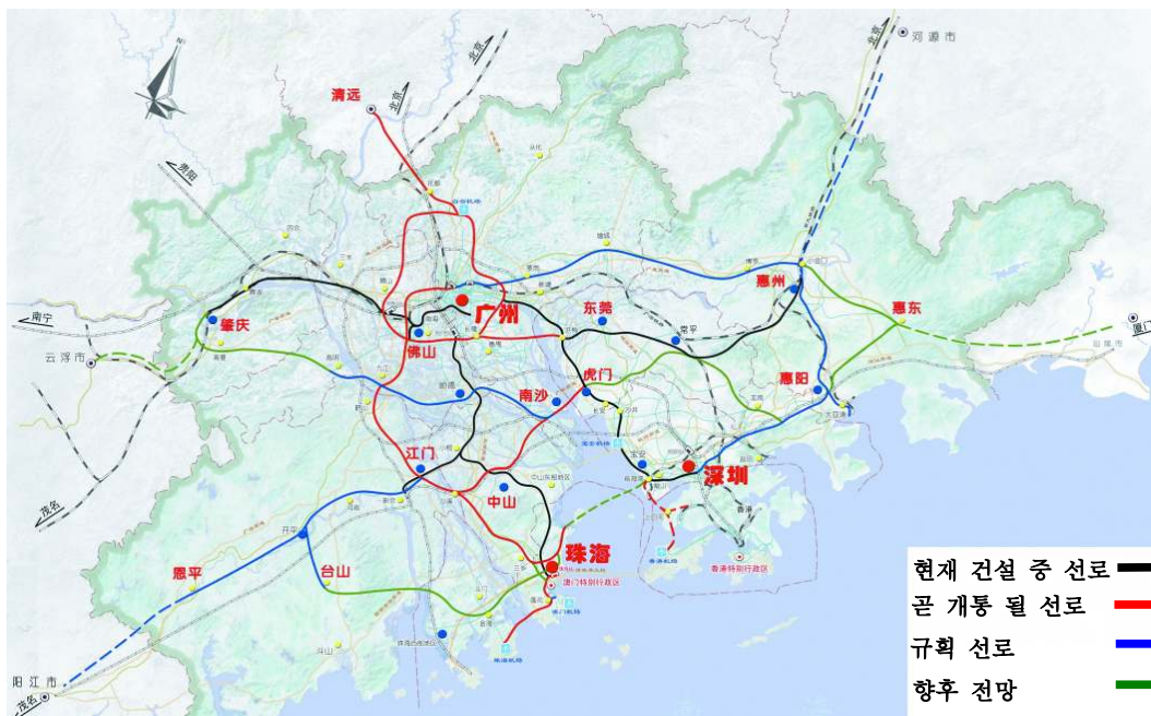
그림 1. 주장삼각주 광역철도 교통배치 계획도

자료: 『珠江三角洲基础设施建设一体化规划(2009-2020年)』(2010), 「广东省人民政府网站」.