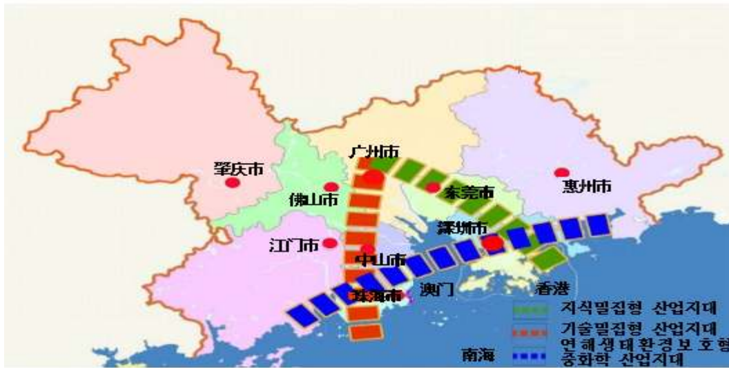
그림 2. 주장삼각주 A자형 산업배치 공간구조