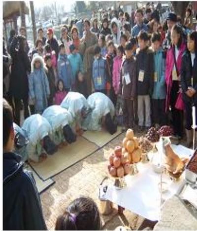
장 승 제