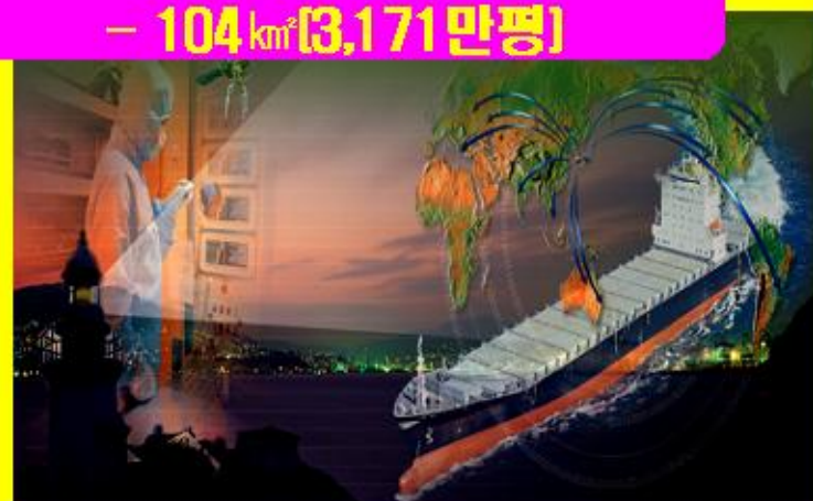
부산-진해 경제자유구역 - 104 km 2 (3,171만평)