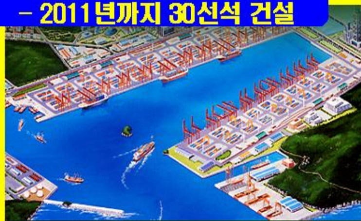
부산신항만 - 2011년까지 30선석 건설