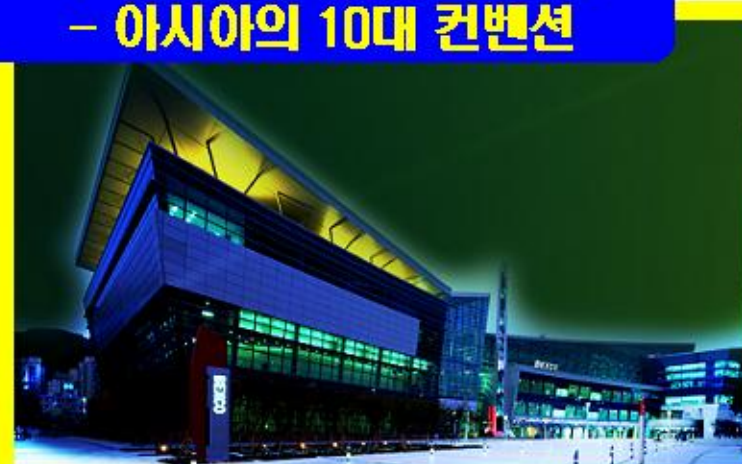
부산전시컨벤션센터 - 아시아의 10대 컨벤션