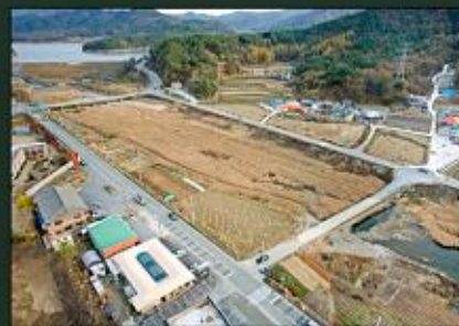
조병천 자연예술 공원