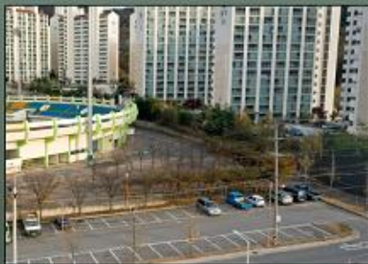
안성맞춤 Community Culture Center