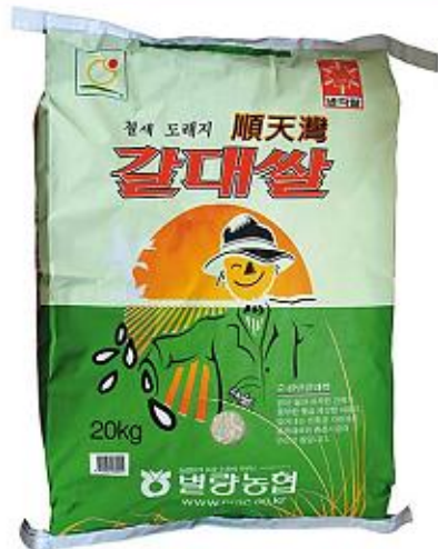
순천만 간척지 생산 순천만 갈대쌀