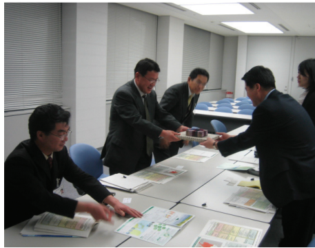
▲일본 사이타미현 관동지방정비국 관계자들로부터 광역지방계획 현황 자료를 받고있는 지역위 방문단

일본 지역정책이 바뀌기 시작한 것은 지난 2005년부터다. 정책기조를 ▶국토개발→국토이용·정비·보전 ▶국가주도 전국계획→지방주도 광역계획(협력계획) ▶균형발전→지역간 경쟁과 특화발전으로 각각 변경하기 시작했다. 균형발전에 초점을 맞춘 전국종합개발계획에 대한 반성의 결과다. 먼저 '국토종합개발법'을 '국토형성계획법'으로 바꾸고, 국가주도의 '전국계획'과 지역주도의 '광역계획'으로 분리하는 국토정책을 수립했다. 전국계획은 지난 2008년 확정해, 현재 광역별로 광역지방계획을 수립하고 있는 단계다.