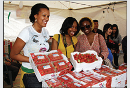
▲논산 딸기축제에 참가한 외국인들

논산딸기가 화려한 부활에 성공했다. 수입개방으로 벼랑 끝에 몰렸던 논산딸기는 민관이 머리를 맞댄지 7년 만에 당도 높은 새 품종을 개발, 끊겼던 일본수출 길을 열고, 지난해 매출도 1,000억 원까지 끌어올렸다. 최근 수출물량만 76만 7,000달러(101톤)에 달한다. 올해는 50톤 이상이 일본·대만·싱가폴·러시아 등으로 팔린다. 논산딸기 축제에는 지난해 100만 명이 몰렸고, 딸기수확 체험에도 관광객 10만 명이 다녀갔다. 한편, 농산물 수출로 부자 된 시골마을은 논산뿐만이 아니다. 군산 쌀은 지난 2007년 이후 미국·러시아·영국·뉴질랜드·두바이 등 7개국에 300톤이 팔렸고, 천안 배도 지난해 1,600만 달러(7,192톤)를 수출한 데 이어, 진주도 2,455만 달러어치의 순수 농산물을 해외에 팔았다.