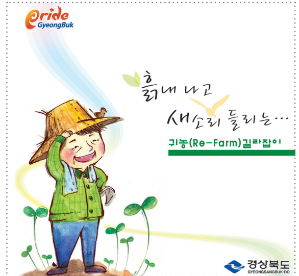
▲경상북도의 귀농안내 책자

경상북도 도의회가 전국 광역자치단체 가운데 처음으로 귀농인 지원 조례 제정을 추진한다. 도의회 농수산위원회는 지난 5월초 '경북도 귀농인 지원 조례안'을 발의했다. 조례안은 경기침체 속에서 성장배경이 농촌이면서 일정한 교육수준과 자산을 보유한 도시민들의 귀농이 붓물을 이루는 가운데 귀농지원을 통한 농촌 일자리 창출과 농업경쟁력 강화 필요성이 커지고 있는 데 따른 것이다. 이번 조례는 경북도 예산범위 내에서 ▶농업기반 확충 및 생산 ▶정착 및 주거▶농업현장 연수 및 컨설팅 등에 대한 지원을 명시하고 있으며, 외부 전문교육기관을 통한 영농기술 교육지원도 규정하고 있다.