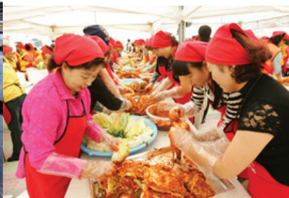
▲광주 김치나눔 사랑메세나 현장

전남 천일염과 광주 김치가 세계 시장 공략에 나섰다. 천일염이 지난해 3월 ‘광물’에서 ‘식품’으로 바뀐 후, 올해 전남지역의 천일염 수출량은 지난해 보다 무려 250% 증가한 154만 6,000만 달러에 이른다. 국가도 미국·독일·일본 등으로 다양하다. 전남은 천일염을 향후 프랑스 ‘계랑드 소금’ 같은 명품으로 육성하기 위해 품질 고급화에 한창이다. 천일염 국내 생산량은 연간 29만 6,000톤으로 이 가운데 87%인 25만 8,000톤이 전남에서 생산되고 있다. 광주는 오는 10월 23일부터 10일간 ‘김치, 천년의 맛’을 주제로 김치축제를 연다. 지난해까지 15회째 김치축제를 지속해온 경험과 반성을 통해 김치축제의 발전적 보완 필요성이 제기되면서, 김치만을 주제로 하기보다는 김치축제를 향후 한국을 대표하는 ‘음식문화축제’로 확대할 방침이다.