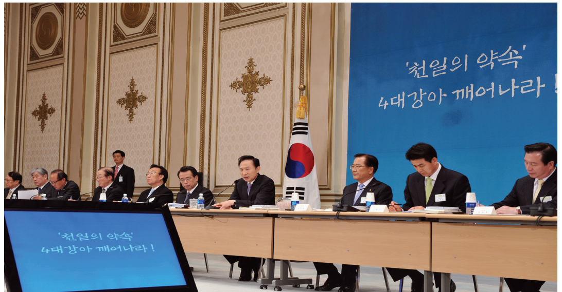
▲ 4대강 살리기 합동 보고대회

범정부 차원의 4대강 살리기가 본격화되고 있다. 4대강 살리기는 물 부족·삶의 질·지역발전까지 겨냥한 다목적 국가프로젝트다. 지난 4월 27일 대통령 직속 지역발전위원회는 이명박 대통령을 모시고, 6개 기관(녹색委·건축委·국토부·환경부·문화부·농림부)과 공동으로 정부역량을 집중하기 위한 4대강 살리기 합동보고회를 가졌다.