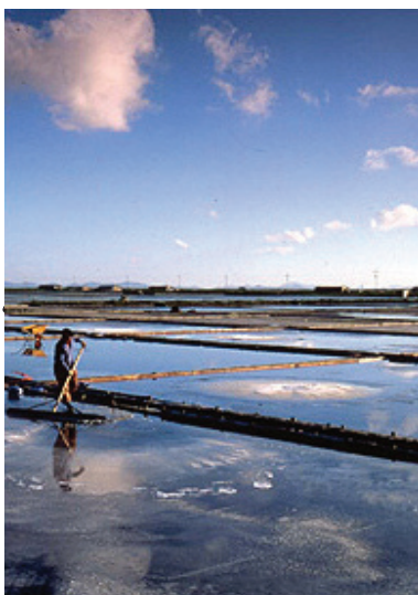
▲전남 천일염 염전