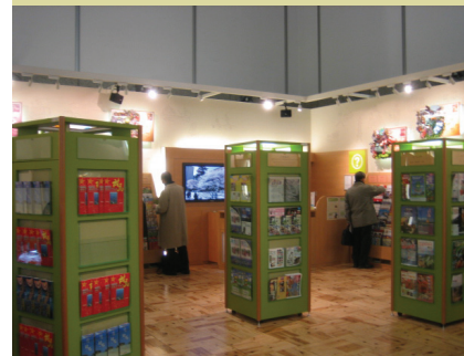
▲일본 도쿄도청에 마련되어 있는 "전국 지자체 관광PR코너" 모습