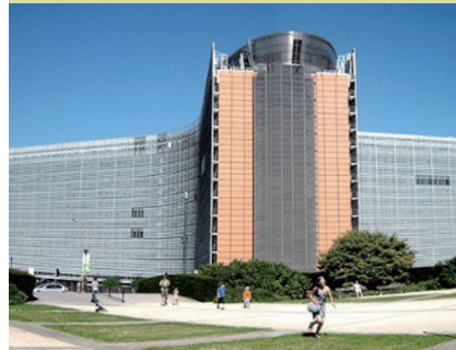
▲ 벨기에 브뤼셀 소재 유럽연합 집행위원회 건물 전경