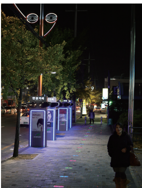
▲대구 안경산업특구 안경거리

경북도가 내년부터 공공건축물에 대한 디자인 가이드라인을 마련, 특색 있는 명품도시 조성에 나선다. 친환경적인 디자인, 녹색커뮤니티를 강조한 격조 있는 도시경관 조성을 위해 경북도가 추진할 공공건축물 디자인 가이드라인의 특징은 크게 두 가지다. 첫째, 사람과 자연이 어우러진 녹색성장의 패러다임을 수용한 친환경 미래도시 디자인이다. 둘째, 전통문화 계승을 위한 역사·문화적 가치존중을 바탕으로 도시계획·경관계획·지역계획과의 연계를 통한 편리한 공간활용 시스템이 구축되게 하는 것이다. 특히 공공건축물 이용자의 눈높이에 맞는 친근한 공간조성의 구체적 기준과 안내가 쉽고 간편한 설명과 함께 제시된다. 경북도는 가이드라인을 토대로 건축물의 배치·형태와 색채·친환경계획·교통처리·경관 등을 고려, 우선적으로 적용이 가능한 공공건축물에 먼저 추진한 뒤 민간건축물로 점차적으로 확산해 조기 정착되도록 할 계획이다.