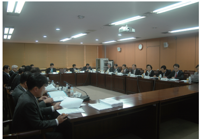
▲ 10월 29일 지역추진위원회 위촉위원 전체회의

이에 따라 향후 국가도시정책은 물리적 시책위주의 정책을 공간·산업·교육·문화·환경 등을 아우르는 선진국형 도시발전전략으로 바뀌고, 개별도시에 국한된 정책을 광역경제권내 대·중·소도시와 연계하는 도시권 발전 및 성장관리 전략으로 재편될 방침이다.