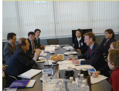
▲ EU 지역위원회 임원과 면담하는 지역위 방문단