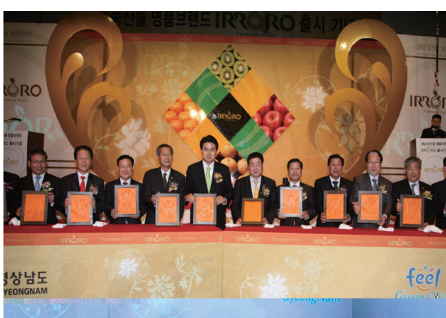
▲경남 명품과일 브랜드 이로로 출시식

경남 고성 환경쌀, 거창 명품사과, 사천 단감이 세계로 뻗어가고 있다. 고성 쌀은 지난 10월부터 LA지역, 거창 사과는 지난 11월 대만으로 수출된 데 이어, 지난해부터 동남아로 수출되던 사천 단감은 지난 10월 전년 대비 30% 이상 수출이 늘었다. 고성 쌀은 1차분 20t이 지난 11월 말 마산항을 거쳐 수출길에 올랐고, 내년까지 총 200t을 수출할 계획이다. 거창 사과는 지난 9월 조생종인 홍로사과 60t을 수출해 1억4,450여만원의 매출을 올렸으며, 연말까지 240t이 대만으로 수출된다. 사천 단감은 지난해 1,200t 110만 달러에서 올해는 1,400t을 수출, 지난해 보다 30% 이상 늘어, 올해 목표인 180만 달러 달성이 무난할 것으로 기대되고 있다.