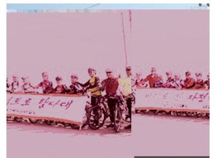
▲바다로 간 자전거도로로 탐사대

지난 11월부터 산업입지법 시행령 개정령이 시행되었다. 이에 따라 앞으로 인구 50만명 이상 대도시의 도시개발공사와 상공회의소도 산업단지 지정을 요청할 수 있게 된다. 종전에는 공기업과 특별시·광역시·도의 도시개발공사 등이 산업단지 지정을 요청할 수 있었으나, 개정령은 민간기업 중 산업단지의 지정을 요청할 수 있는 자의 범위에 대도시의 도시개발공사와 상공회의소를 추가했기 때문이다. 또 사업시행자가 산업시설용지 공급시 산업단지 지정권자와 입주협약을 체결하고 유치업종의 배치 계획에 포함된 기업에 대해서는 수도권·광역시, 대도시에서도 산업시설용지를 수의계약 방식으로 공급할 수 있도록 했다. 추천방식으로 공급할 경우 지자체가 정책목적상 유치한 기업에 산업용지를 공급하기가 곤란하다는 지적 때문이다. 산업단지의 경우, 당해 산단에 입주할 기업을 미리 유치, 선정된 이후 지정·개발에 착수하는 경우가 대부분이다.