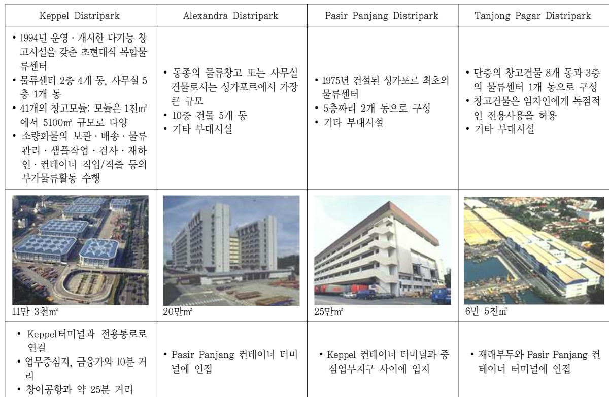
【 표 3 】 싱가포르항 배후 복합물류센터