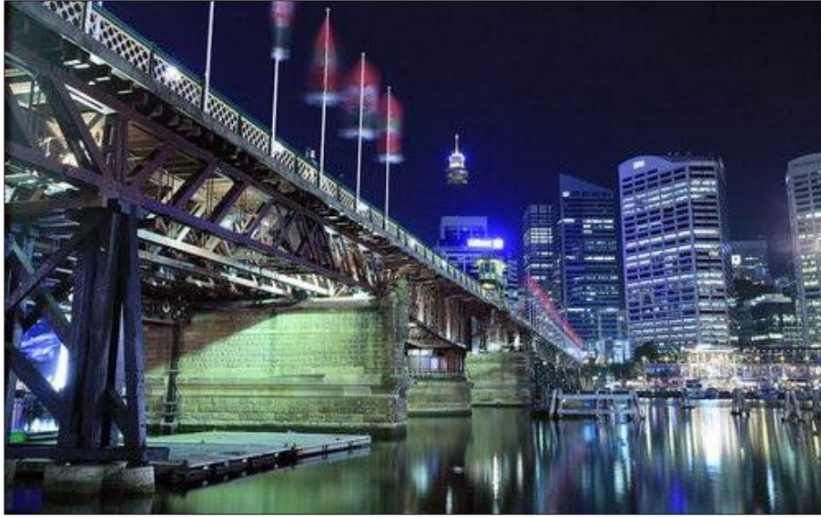
[그림 3] 호주 시드니 달링하버 야경