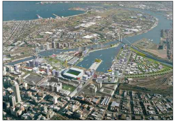
[그림 2] 영국 런던 도크랜드 전경