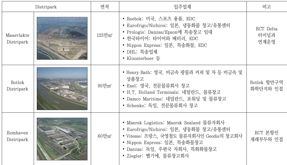
【 표 2 】 네덜란드 로테르담항 물류단지

출처: 국토연구원 · 한국해양수산개발원, 2006. 전국무역항 항만배후단지개발종합계획. p33.