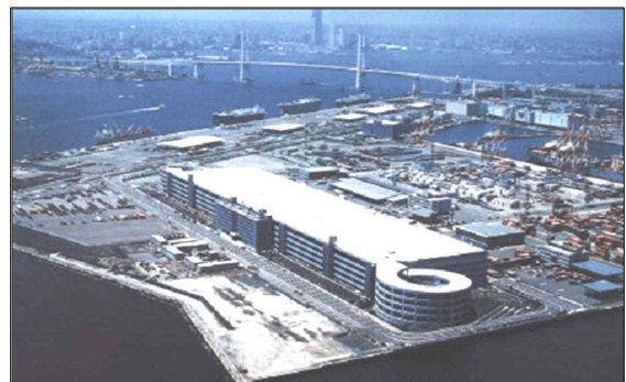
[그림 4] 일본 요코하마 미나토미라이 전경