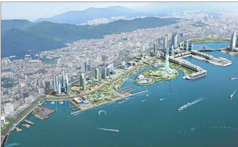
〔그림 1〕 부산 북항 재개발사업 조감도