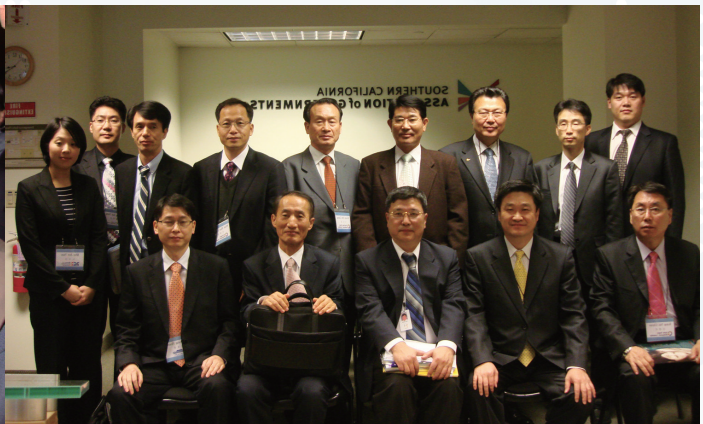
▲로스앤젤레스 SCAG에서 기념촬영한 연수단