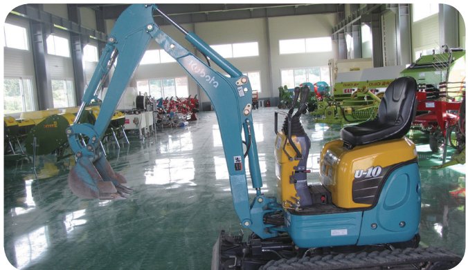
▲논산시 농업기술센터 농기계임대사업소 농기계 창고

농림수산식품부는 2010년도 농기계임대사업 대상자로 61개 사업소(시·군)를 선정하고 500억원(국고 250억원, 지방비 250억원)의 사업비를 지원할 방침이다. 선정된 사업자에게는 한곳당 6억~12억원을 지원해 임대용 농기계를 구입하거나 보관창고 설치, 관리장비 구매 등에 쓰도록 할 예정이다. 이번 사업자 선정에 따라 농기계 임대사업소는 전국적으로 134곳에서 166곳으로 32곳이 늘게 됐다. 기존의 임대사업소 가운데 29곳은 수요 증가로 시설·장비를 증설하게 된다. 농기계 임대사업은 가격에 비해 사용일수가 극히 적어 이용효율이 떨어지는 농기계나 발농사의 이식·수확작업처럼 기계화율이 낮은 분야의 농기계를 정부가 구입해 빌려 주는 사업이다. 농식품부는 임대사업소를 장기적으로 350곳까지 늘려 시·군당 2~3곳을 운영할 계획이다.