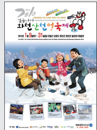
▲2010 산천어축제 포스터

화천 산천어축제가 유사축제와의 차별화에 나섰다. 화천군에 따르면, 다른 지역의 유사한 겨울축제 개최가 잇따르면서 산천어축제의 고급화와 국제화를 통한 차별화 정책을 추진하기로 했다. 이에 따라 계곡의 여왕이라 불리는 산천어가 1급수 맑은 물에 서식하고 다량의 아미노산을 함유하고 있는 점 등을 들어 건강식으로서의 장점을 부각시켜 나가기로 했다. 또 관광객들의 편의 도모와 축제장내 도우미들의 서비스 제고 등 모든 프로그램의 고급화를 모색할 계획이다. 특히 해가 갈수록 외국인 관광객의 비중이 높아짐에 따라 프로그램 운영에 투입된 대학생 아르바이트생을 비롯한 공무원들을 대상으로 기본적인 영어안내 매뉴얼을 제작 활용키로 했다. 이와 관련, 화천군 관계자는 "상당수 신생 겨울축제가 8년간 시행착오를 거듭하면서 다듬어져 온 산천어축제를 모방·운영하는 복제수준에 머물고 있다"면서 "독특한 아이디어 발굴을 통한 차별화가 절실하다"고 말했다.