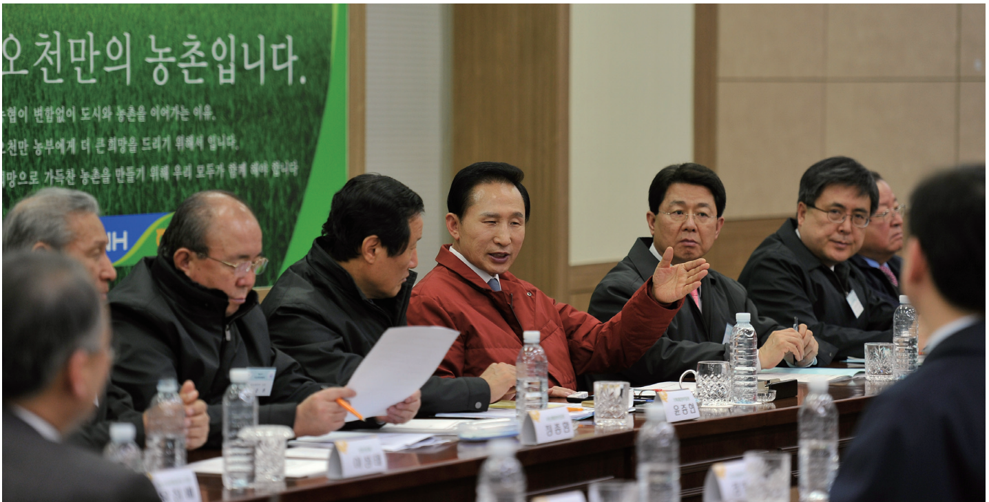
▲제43차 비상경제대책회의(2010.1.20)를 주재하는 이명박 대통령. 이 대통령은 '지역발전'을 새해 국정운영 5대과제에 포함시켰다.

○ 대통령 직속 지역발전위원회(이하 지역총)가 2010년 새해부터 피부에 와 닿는 지역발전 정책을 본격화한다. 이명박 정부의 대표적인 지역정책인 광역경제권을 통한 일자리 창출, 혁신도시-기업도시-경제자유구역의 활성화, 그리고 지방소득세-지방소비세-지역상생발전기금과 같은 자주재원 확충 등이 그것이다. 이는 이명박 대통령이 신년 국정연설에서 '2010년=지역발전 전기마련'의 원년으로 천명하고, 지역발전을 국정운영 5대과제에 포함시킨 데 따른 것이다. < 2면 계속 >