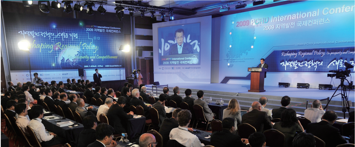
▲ 지난해 7월 열린 광역경제권 국제컨퍼런스 개최식 장면, 지역청은 지난해에 이어 올 7월 초광역 국제컨퍼런스를 개최한다.

지역청은 지난 2년간 균형+성장이라는 새로운 패러다임의 지역발전 철학과 정책 구현을 위한 법·제도 마련에 몰두해 왔다. ▶법령개정(국가균형발전특별법) ▶중기 종합계획수립(지역발전5개년계획) ▶3차원 지역정책 정립(광역경제권·기초생활권·초광역개발권 발전방향 및 기본구상) ▶추진기구 설립(5+2 광역경제권발전위원회) ▶지방재정 지원체계 개편(지방소득·소비세 도입, 포괄보조금제도 도입)로 상징되는 광역·지역발전특별회계 개편 ▶광역경제권 핵심사업 착수(선도산업·인재양성, 30대 선도프로젝트) 등이 그렇다.