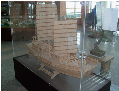
▲나주목선-나주시청 현관에 전시된 나주선 모형 (실제의 1/20 크기)

고려시대 영산강을 오갔던 고대 목선이 다시 복원돼 관광유람선으로 활용된다. 나주시에 따르면 사업비 8억원을 투입해 10세기를 전후로 영산강과 나주를 오갔던 고대 목선인 '나주선'을 연말까지 복원할 계획이다. 나주선은 길이 29.9m, 너비 9.9m, 높이 3.16m에 95급, 승선 인원은 96명으로 지난해 9월 실시설계가 완료되고, 최근 '청해진 선박연구소'에 제작을 의뢰했다. 이 배는 지난 2004년 4월과 지난 해 3월 영산동 영산강 바닥에서 목선 만곡부와 결판, 나무못 등이 발견된 고선박을 컴퓨터 3차원 분석 등을 통해 복원한 것이다. 조사결과 이 선박은 고려 초 곡물이나 물건 등을 실어나르는 조운선(漕運船)인 초마선으로 추정됐다. 시는 발굴된 목선을 토대로 복원하되 활용성을 높이기 위해 모터를 장착한 관광 유람선 형태로 운영할 계획이다.