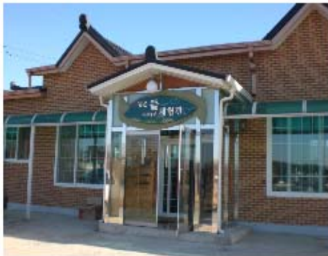
그림 3-2. 광대2리 녹색농촌체험관