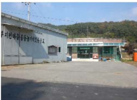
그림 3-8. 천장리 마을회관