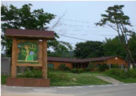
그림 3-4. 부래미마을 입구