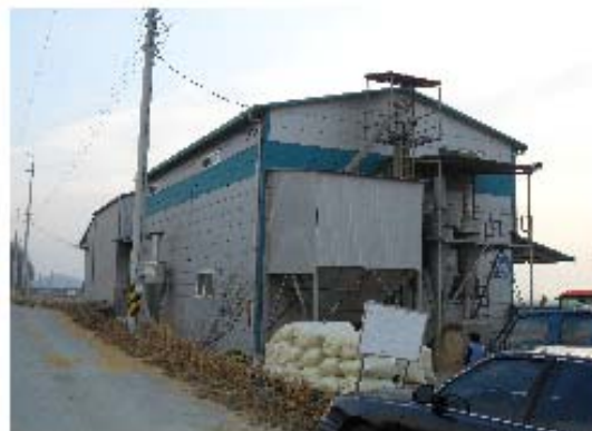
그림 3-14. 양지말영농조합 정미소 전경