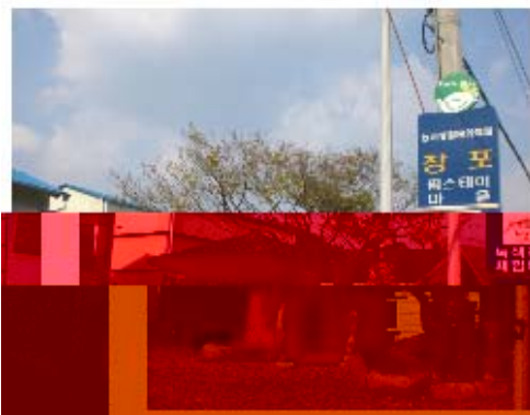
그림 3-10. 창포마을 입구