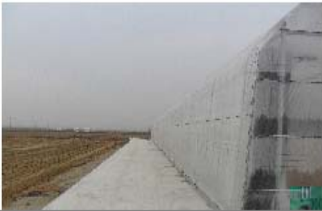
그림 3-12. 신평리 들녘 전경