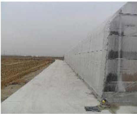
그림 3-12. 신평리 들녘 전경