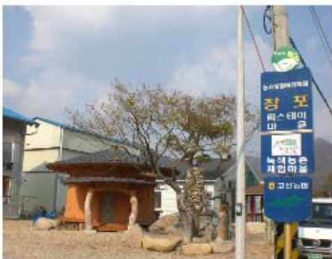
그림 3-10. 창포마을 입구