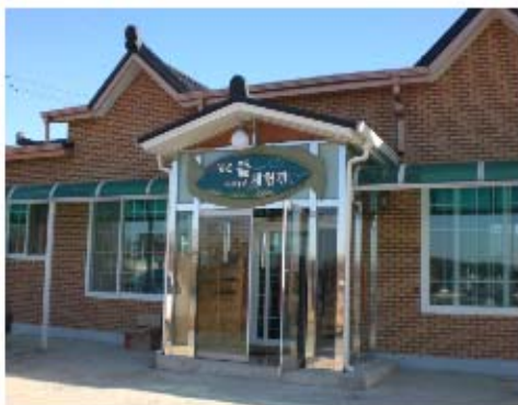
그림 3-2. 광대2리 녹색농촌체험관