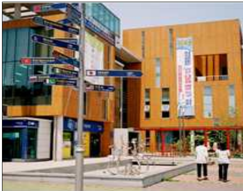
[그림 2] 안산시 외국인주민센터(좌), 인천 차이나타운 거리(우)