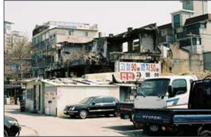
[그림 1] 서울 가리봉동 거리