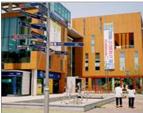
[그림 2] 안산시 외국인주민센터(좌), 인천 차이나타운 거리(우)