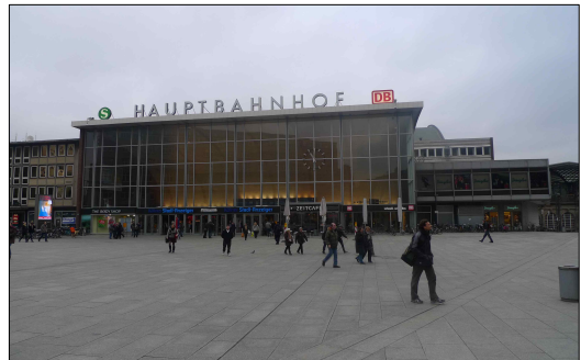
【그림 5】 쾰른 중앙역