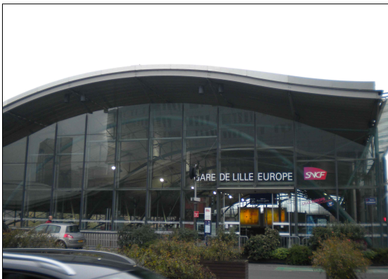
【그림 3】 릴-유럽역