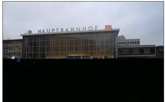
[그림 5] 쾰른 중앙역