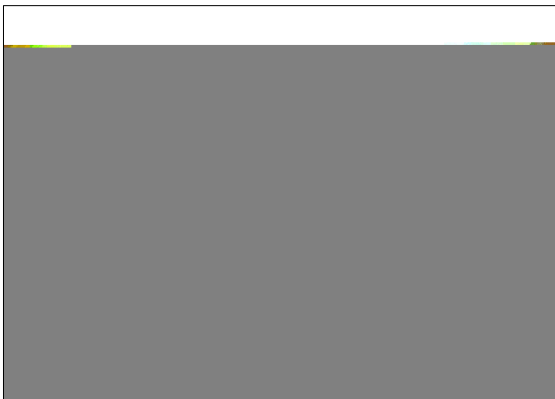
[그림 3] 릴-유럽역