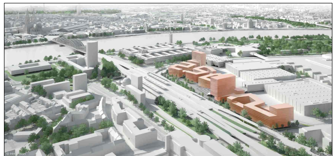
[그림 6] 쾰른 메세역(Messe) 역세권 개발 조감도