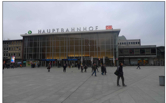
[그림 5] 쾰른 중앙역