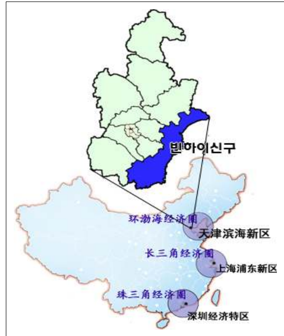
[그림 1] 중국 3대 경제권과 빈하이신구 위치