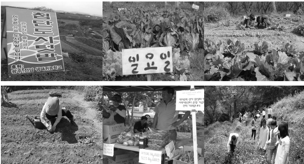
자료 : 광주전남귀농학교( http://cafe.daum.net/landlovers ), 교육문화공동체결( http://gyeol.org/ )