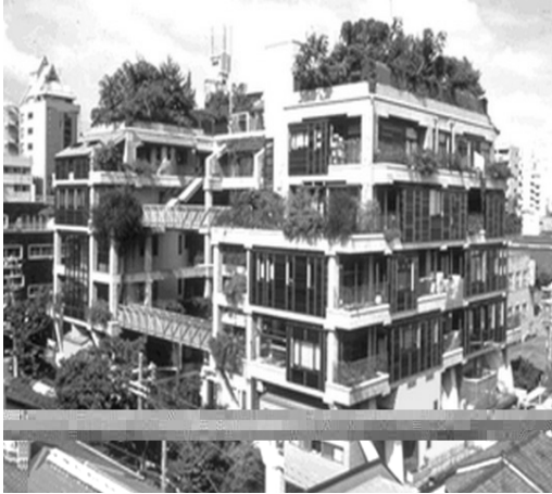
오사카 'NEXT21' 주택