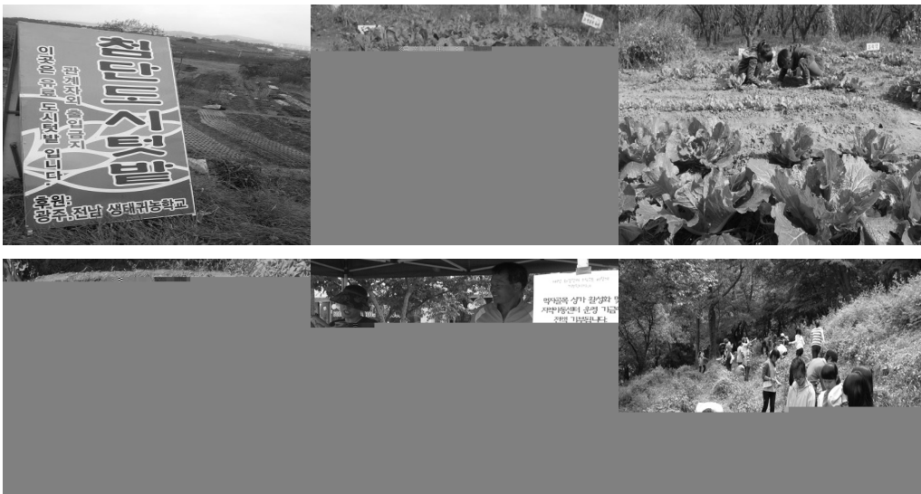
자료 : 광주전남귀농학교( http://cafe.daum.net/landlovers ), 교육문화공동체결( http://gyeol.org/ )