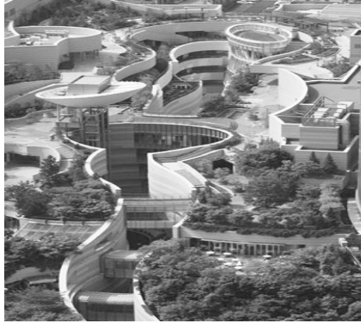
오사카 '난바파크' 지구