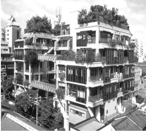
오사카 'NEXT21' 주택