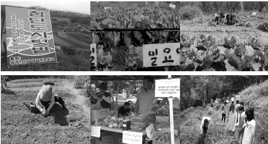
자료 : 광주전남귀농학교( http://cafe.daum.net/landlovers ), 교육문화공동체결( http://gyeol.org/ )