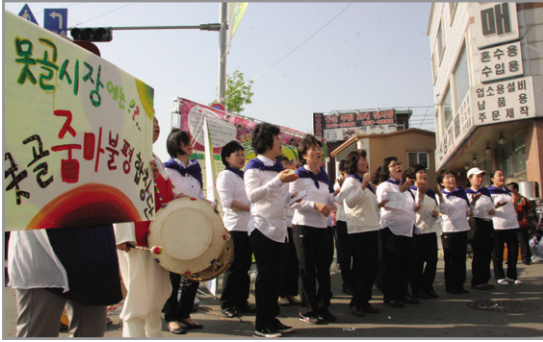
▶ 못골시장 줌아불평 합창단