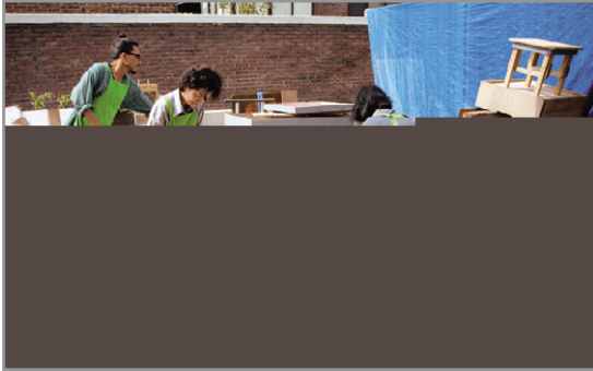
▶ 수유마을시장 마을목공교실