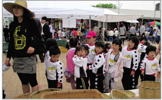
▶ 한산테마장을 즐기는 아이들