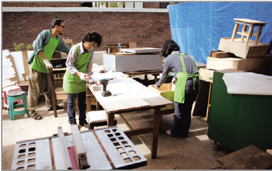
▶ 수유마을시장 마을목공교실