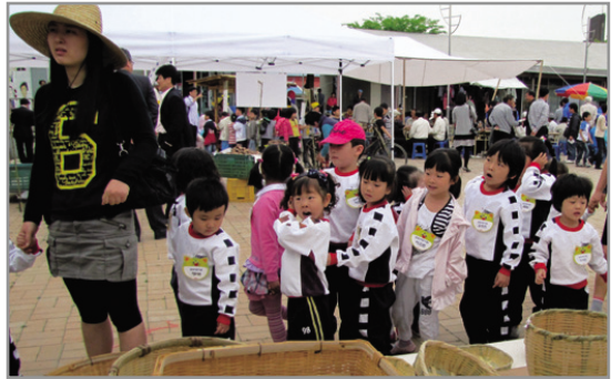
▶ 한산테마장을 즐기는 아이들