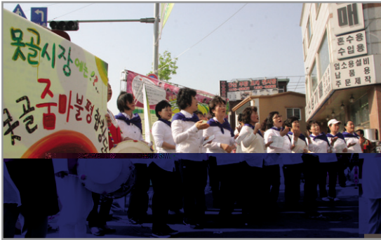
▶ 못골시장 줌아불평 합창단