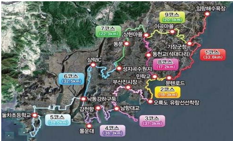
(그림3) 갈맷길 9코스