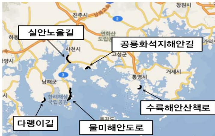
(그림2) 경남 해안누리길 노선 현황도