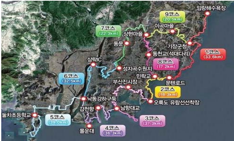
(그림3) 갈맷길 9코스