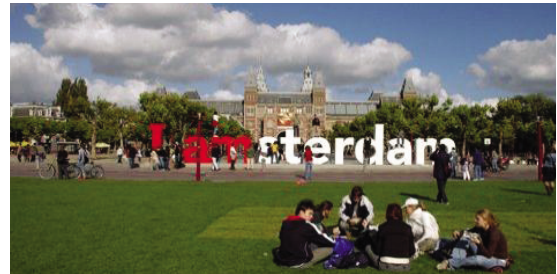
네덜란드 암스테르담 도시브랜딩 'I Amsterdam'

네덜란드의 수도 암스테르담의 도시브랜딩은 ‘I Amsterdam’이다. 이 브랜딩 전략은 도시관측을 통해 지역경제 활성화를 추구함과 동시에 도시에 대한 자긍심을 시민들에게 불어넣음으로써 사회통합을 동시에 추구하는 방식을 취하고 있다. 주요 특징을 정리하면 다음과 같다.