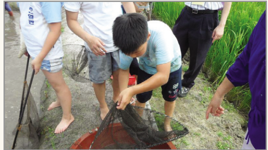
KL z(aaß@ !_ _Y

주민들이 학교를 방문하여 농작물 재배방법을 가르치고, 학교와 공동으로 직거래장터를 운영하는 등 교류 활성화를 위한 상호노력의 결과로 학교의 마을 방문 횟수가 2010년 47회였던 것이 2011년에 126회로 증가하였으며, 학생 참여 수도 2010년 3,868명에서 2011년 5,803명으로 크게 증가한 것으로 나타났다.