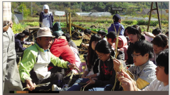
Y± Ø aaß@ œY Y