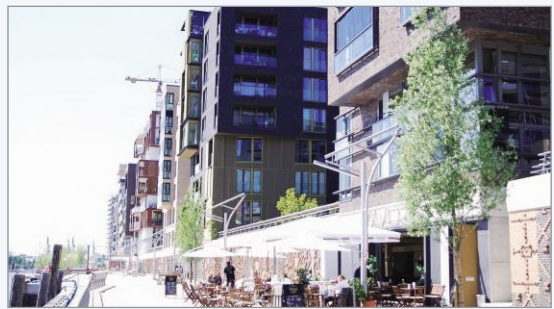
하펜시티 수변 주거지역

사실 하펜시티 도시재생사업을 이해하는 데는 또 하나의 거대프로젝트 “엘베강을 넘어(Sprung ueber die Elbe)”를 이해하는 것이 우선이다. 이 프로젝트는 함부르크시의 점차 낙후되고 고령화되어 가는 지역에 대한 발전전략 구성을 위해 하나의 띠 형태로 나타나는 지역에 대한 발전전략으로, 함부르크시 중심가에서부터 하펜시티를 필두로 하여 페텔, 빌헬름스부르크 그리고 하부르거 비넨하펜 지역까지를 아우르는 대규모 지역발전사업이다. 여기에는 대규모 이벤트인 국제건축박람회(Internationale Bauausstellung 2013) 및 국제조경박람회(Internationale Gartenschau 2013)가 열리게 되는 빌헬름스부르크가 있으며, 궁극적으로 하펜시티는 이 모든 사업의 출발점에 있다. 따라서 하펜시티에 대한 도시재생전략 수립은 지역 자체만의 발전적 성향을 가진 도시재생수법을 제시