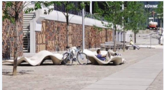
달만카이에 조성된 산책로