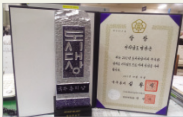
2012년 도시대상-선도사례부문 국무총리상