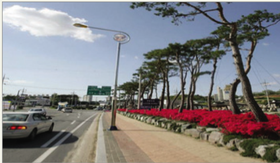
도로변 경관이미지 개선 및 아름다운 거리