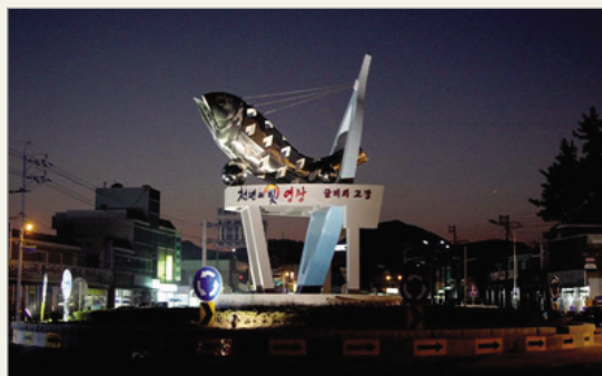
글로벌 영광 굴비타워

두 번째는 디자인 경영활동으로 농촌주민과 도시민에게 자연친화적인 휴식 및 전통문화체험공간을 제공하고, 농촌지역 경제 활성화에 기여하고자 불갑면 불갑저수지 수변에 산책로와 체험센터 등 테마공원을 조성하는 사업을 추진 중이다. 또한, '천년의 빛'을 상징하는 조형물 및 소나무 가로수길 조성사업을 펼치고 있다. 이 사업은 지역 정체성을 표현하는 '천년의 빛'을 담은 기를 상징하는 '글로벌 영광타워' 조형물을 설치하여 지역의 정책비전을 드러냈다. 뿐만 아니라 군민이 참여한 현수운동을 통해 특색 있는 소나무 가로수길을 조성하여 지역주민의 자긍심을 높였다. 또, 영광을 대표하는 수산물인 굴비를 형상화하여, '굴비의 고장' 이미지를 가장 잘 나타낼 수 있는 조형물 조성사업을 전개함으로써 관광