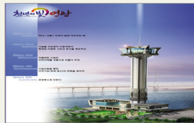
항화도 바다매체 타워 우수상

대상-선도사례부문' 국무총리상, '2012 대한민국 디자인대상' 지식경제부장관상을 수상했다. 지난해에는 국토해양부 주관 '제1회 대한민국 경관대상'에서 자연경관분야 전국1위로 최우수상, 행정안전부 주최 '2011 국제 공공디자인 대상'에서 영광군 문화예술회관과 영광바다매체타워(111m)가 각각 대상과 우수상 수상, 전라남도 주관 '시·군 경관행정 종합평가' 최우수상을 수상하기도 했다.