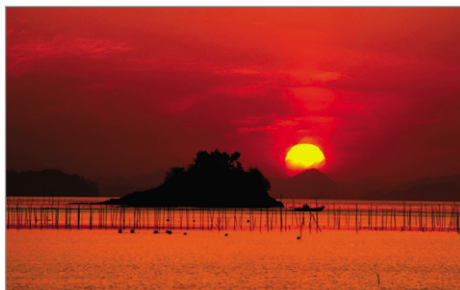
영광 백수해안도로 노을길(2.3km) 및 노을 광경

그 첫 번째가 영광 백수해안도로 노을길(2.3km) 및 노을전시관 조성사업이다. 총 길이 16.8 km에 이르는 백수해안도로는 석양이 가장 아름답게 보이는 곳으로, 인근에는 관광휴양단지인 해수온천랜드, 칠산 전망대, 영광 칠산도 꿩이갈매기·노랑부리백로·저어새 서식지, 모자바위·거북바위 등 기암괴석과 해수점이 있는 대표적인 관광명소다. 영광군은 지리적·지명적 특성과 차별화를 위하여 전국 최초로 석양노을을 테마로 하는 노을전시관을 완공하여 야간경관을 형성, 지역의 상징성을 높였다.