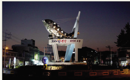
글로벌 영광 굴비타워

두 번째는 디자인 경영활동으로 농촌주민과 도시민에게 자연친화적인 휴식 및 전통문화체험공간을 제공하고, 농촌지역 경제 활성화에 기여하고자 불갑면 불갑저수지 수변에 산책로와 체험센터 등 테마공원을 조성하는 사업을 추진 중이다. 또한, '천년의 빛'을 상징하는 조형물 및 소나무 가로수길 조성사업을 펼치고 있다. 이 사업은 지역 정체성을 표현하는 '천년의 빛'을 담은 기를 상징하는 '글로벌 영광타워' 조형물을 설치하여 지역의 정책비전을 드러냈다. 뿐만 아니라 군민이 참여한 현수운동을 통해 특색 있는 소나무 가로수길을 조성하여 지역주민의 자긍심을 높였다. 또, 영광을 대표하는 수산물인 굴비를 형상화하여, '굴비의 고장' 이미지를 가장 잘 나타낼 수 있는 조형물 조성사업을 전개함으로써 관광