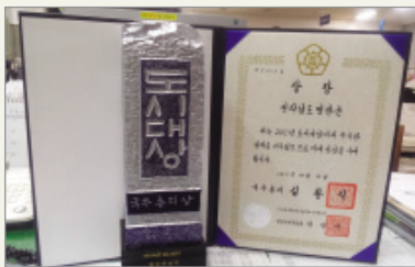
2012년 도시대상-선도사례부문 국무총리상