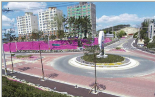
글로벌 영광 굴비타워