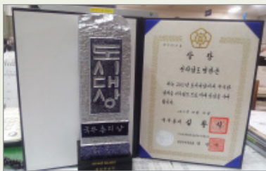
2012년 도시대상-선도사례부문 국무총리상