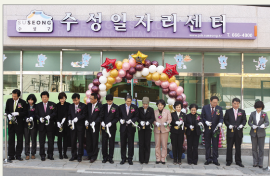
수성일자리센터 1인창조기업 개소식

선정·지원한 결과 39명의 신규고용을 창출하고 2개의 기업이 벤처기업 인증을 획득하는 성과를 거두었다.