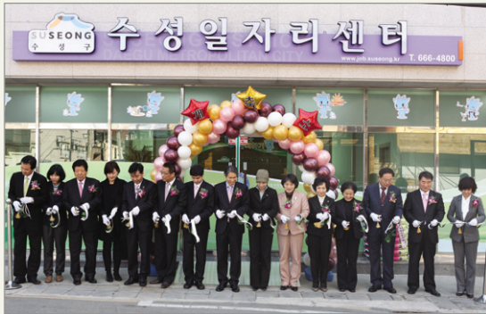
수성일자리센터 1인창조기업 개소식

39 2 3 9, 77 2 3 2% 5 10 (2 20) )가 9 (67 608 ), 9 (6 56 )가 , 6 (1 6 )가 25 (3 76 ), 60 (1 60 )가